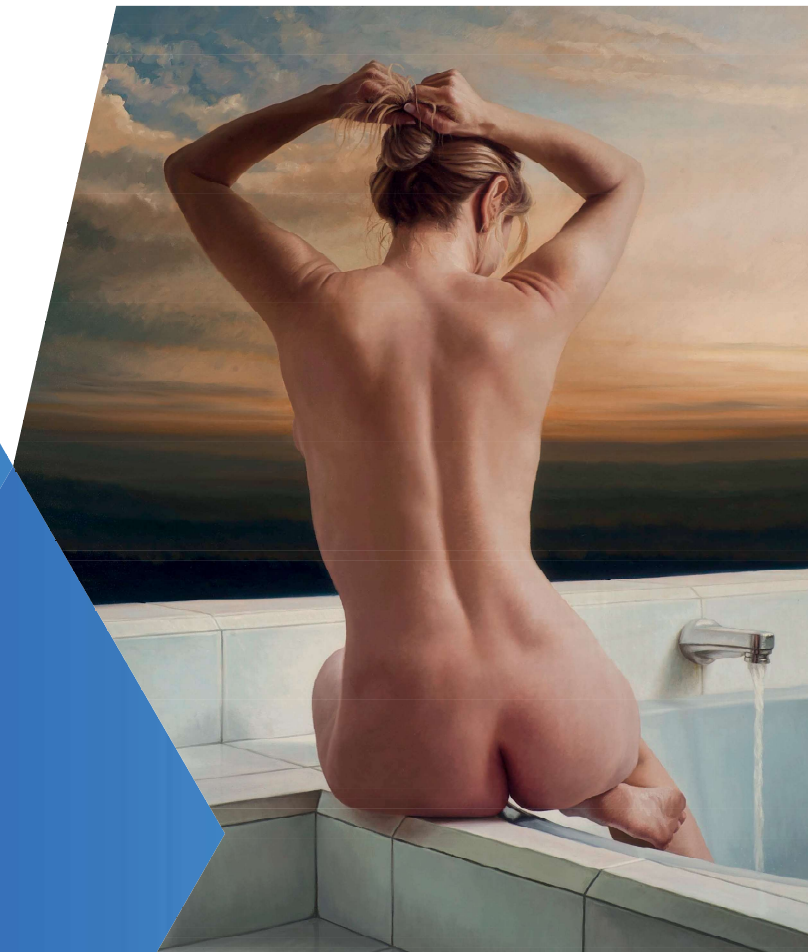
DE LA SERIE "BAÑOS DE LUZ". Autor: Belarmino Miranda.

el crecimiento artístico, intelectual y personal del ser, basados en una pedagogía integral desde el saber y el hacer, buscando el pleno desarrollo de su potencial.