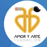
Asamblea Asociados Fundación

En la Fundación, orientamos nuestros esfuerzos a promover la práctica de las artes plásticas con una visión ancestral en su concepción, siendo novedosa en su aplicación .